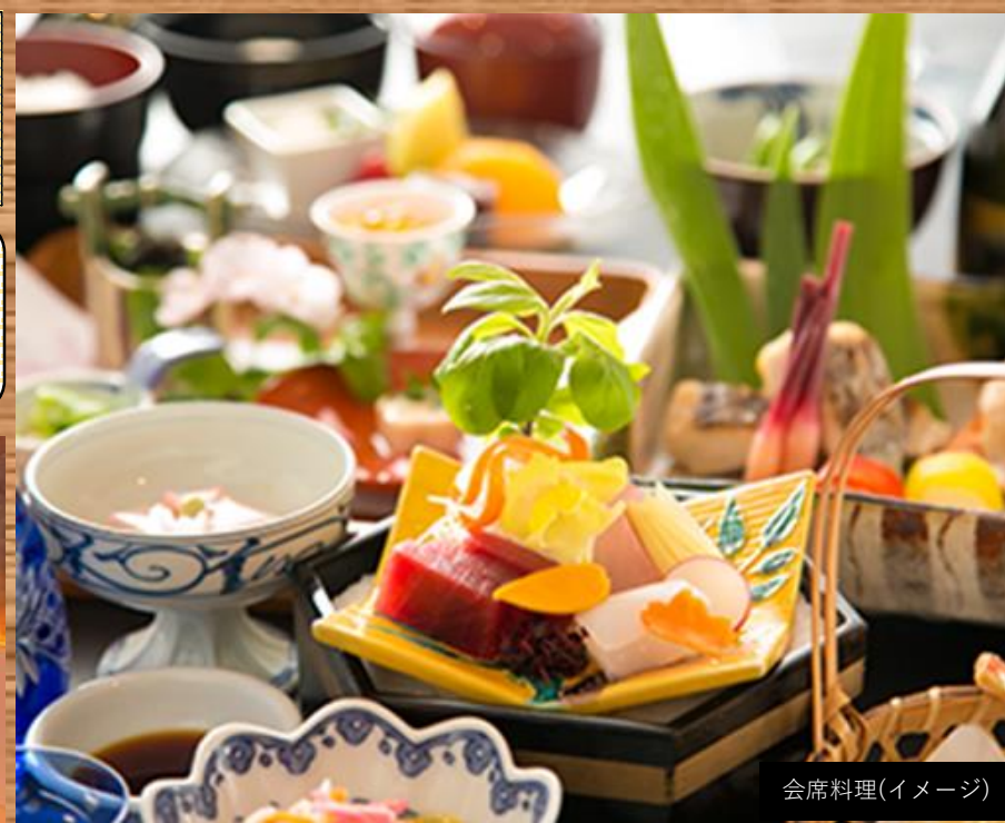
会席料理(イメージ)