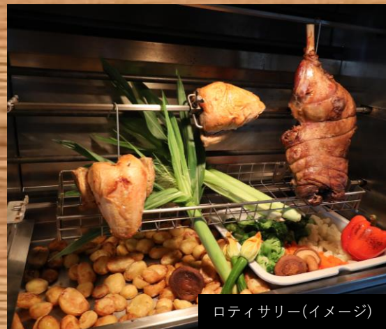
ロティサリー(イメージ)

1958年8月1日、日本で初めて“バイキング”という食のスタイルを帝国ホテル 東京で誕生させた当レストランは、2023年8月1日で65周年を迎えリニューアルオープンし、これまでの帝国ホテルらしい上質なフランス料理に、中国料理と日本料理が加わります。