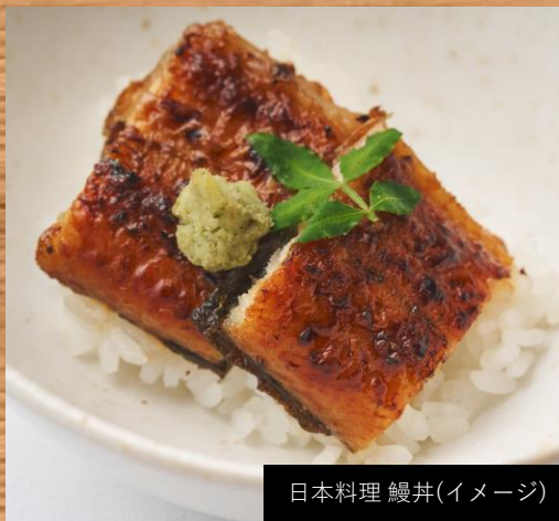
日本料理 鰻井(イメージ)