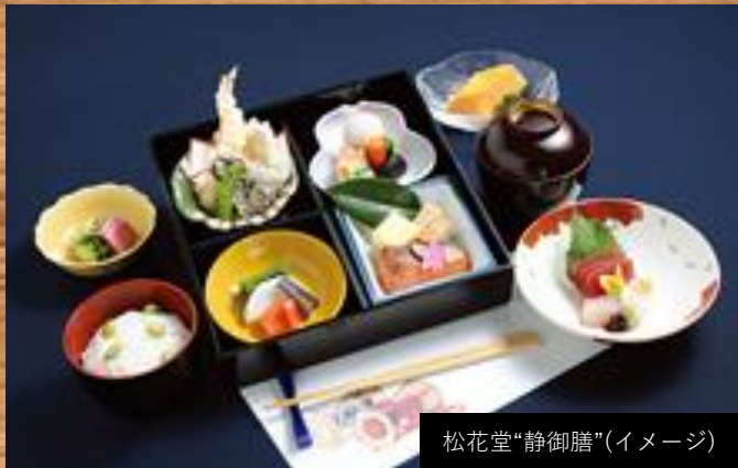
松花堂“静御膳”(イメージ)