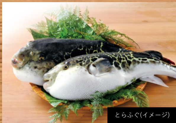
とらふぐ(イメージ)