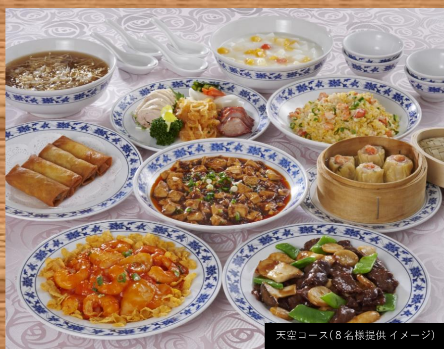
天空コース(8名様提供イメージ)

横浜中華街のランドマーク「ローズホテル横浜」1階に広がるレストランフロアはホテルならではのサービスで、ご家族やプライベートなお集まりでのご利用にもお勧めです。お料理のスパシー加減も承りますのでお気軽にスタッフにご相談ください。