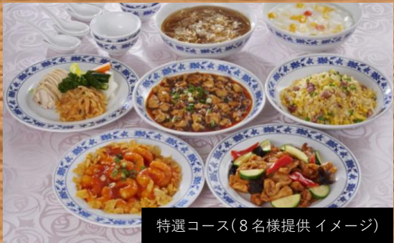
特選コース(8名様提供イメージ)