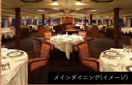
メインダイニング(イメージ)